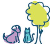
Μέριμνα για το Περιβάλλον