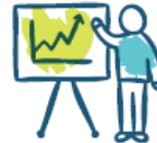
Οι Άνθρωποί μας