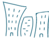
Διακυβέρνηση και οικονομική βιωσιμότητα

Σύμφωνα με τον τελευταίο απολογισμό βιώσιμης ανάπτυξης του Δήμου μας, η ορθολογική διαχείριση των οικονομικών του Δήμου και η αποτελεσματική διακυβέρνησή του αποτελούν στρατηγικό πυλώνα για την επίτευξη Βιώσιμης Ανάπτυξης. Ο Δήμος αντιλαμβανόμενος τη σημασία της οικονομικής του βιωσιμότητας αποσκοπεί συνεχώς στη μείωση του κόστους των λειτουργιών, στη βελτίωση των αποθεματικών, στην εξεύρεση και την αξιοποίηση χρηματοδοτήσεων και χρηματοδοτικών εργαλείων, στην εξασφάλιση της συνεχούς ρευστότητας. Η χρηστή διακυβέρνηση και η εφαρμογή