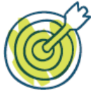
Διακυβέρνηση & Οικονομική Βιωσιμότητα

Μέσω αυτής της διαδικασίας συντάχθηκε ένας κατάλογος εικοσιπέντε θεμάτων υψηλής σημασίας και προτεραιότητας για την βιώσιμη ανάπτυξη τα οποία κατηγοριοποιήθηκαν σε πέντε πυλώνες οι οποίοι περιγράφονται στους απολογισμούς βιώσιμης ανάπτυξης που έχει εκδώσει ο Δήμος μας και φαίνονται στο παρακάτω σχήμα: